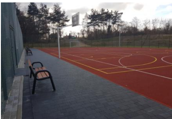
Na zdjęciu: Boisko wielofunkcyjne przy SP w Czernicy.