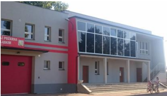
Na zdjęciu: Łukowski Dom Sportu po termomodernizacji.

Budżet na 2017 rok to bardzo ambitny budżet zawierający wiele zadań. Mam nadzieję, że uda nam się pozyskać środki na termomodernizację Szkoły Podstawowej w Gaszowicach. Jeśli to się powiedzie to już w tym roku mogą rozpocząć się prace budowlane.