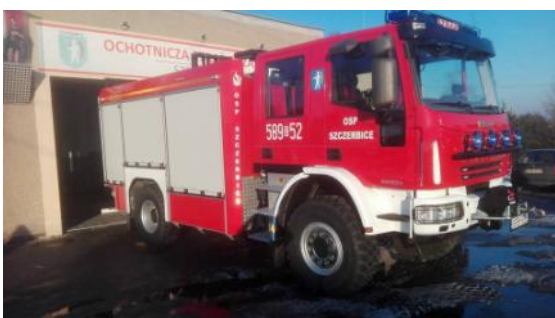
Na zdjęciu: Nowy wóz strażacki OSP Szczerbice.

Ogólnie dokończyliśmy wymianę wiat przystankowych. W dalszym ciągu prowadzone będą kolejne remonty dróg gminnych oraz konserwacja rowów melioracyjnych. Urząd Gminy w ubiegłym roku zorganizował kiermasz wielkanocny oraz drugą edycję jarmarku bożonarodzeniowego. W Łukowie Śląskim odbyły się dożynki powiatowe w ramach Zakończenia Lata. Warto przypomnieć, że na tej uroczystości gościliśmy delegacje miast partnerskich z Czech, Słowacji i Niemiec.