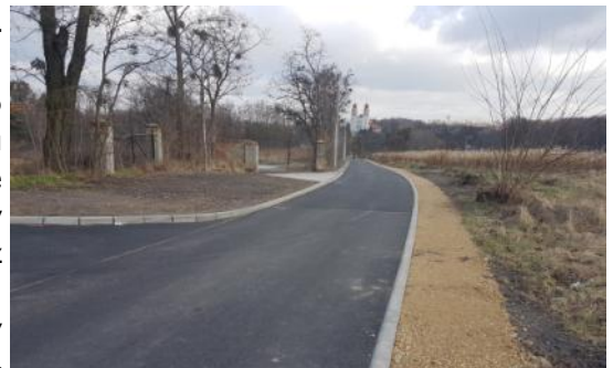
Na zdjęciu: Wyremontowana ul. Sobieskiego w Czernicy.

Będziemy podchodzić do wykonania projektu budowy kanalizacji sanitarnej dla centrum Gaszowic oraz ulicy Wiejskiej.