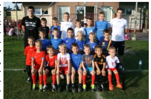
Na zdjęciu: Piłkarska grupa skrzatów.