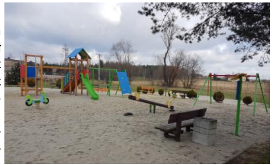
Na zdjęciu: Nowe elementy placu zabaw w Piecach.

Kończąc chciałbym podziękować Wszystkim za pomoc w realizacji tych wszystkich zadań oraz cenną współpracę mając nadzieję, że obecny rok będzie dla nas wszystkich dobry i pomyślny.