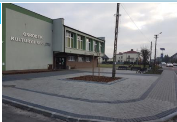
Na zdjęciu: Skwer przed gaszowickim OKiS-em. uporządkowany został teren przed OKiS-em,

W Czernicy przy Szkole Podstawowej powstało długo oczekiwane, boisko wielofunkcyjne na realizację którego część środków pochodziła z funduszy zewnętrznych. Także ulica Sobieskiego, na którą udało nam się pozyskać dofinansowanie (w wysokości 50% wartości inwestycji), doczekała się gruntownego remontu m.in. wybudowana została kanalizacja deszczowa oraz oświetlenie uliczne. Zagospodarowany został teren w centrum sołectwa obok szatni klubowej.