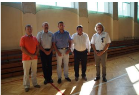
Na zdjęciu: Wizyta zagranicznych partnerów w Gaszowicach.