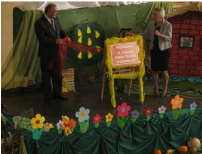
Na zdjęciach od góry: 1,2 - 20 lecie Chóru „BEL CANTO”; 3 - Nadanie imienia Przedszkolu w Gaszowicach.