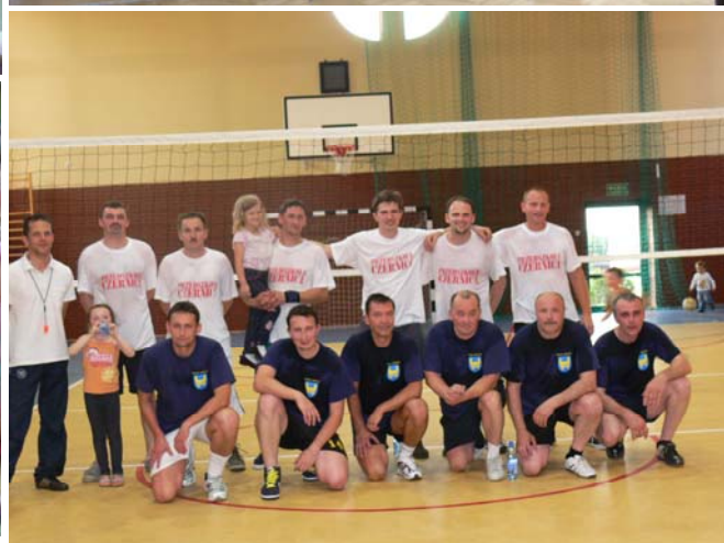
Zdjęcia na ostatniej stronie, lewa strona od góry: 1 - Uczestnicy turnieju piłkarskiego 4 klas; 2 - Uczniowie SP Gaszowice nad morzem; 3 - Wykład Stażników Miejskich w SP Czernica; 4 - Czernickie Przedszkolaki; strona prawa od góry: 5 - Występ z okazji Dnia Matki; 6 - Najlepsi sportowcy szkolni z Wójtem Gminy; 7 - Zwycięzcy konkursu plastycznego o tematyce BHP; 8 - Mecz siatkówki Rodzice Przedszkolaków z Czernicy kontra Samorządowcy Gminy Gaszowice i Powiatu Rybnickiego.

Redakcja: Urząd Gminy Gaszowice ul.Rydułtowska 2, 44-293 Gaszowice Tel.: (32) 43 27 140 Faks: (32) 43 27 141 E-mail: gcigaszowice@wp.pl